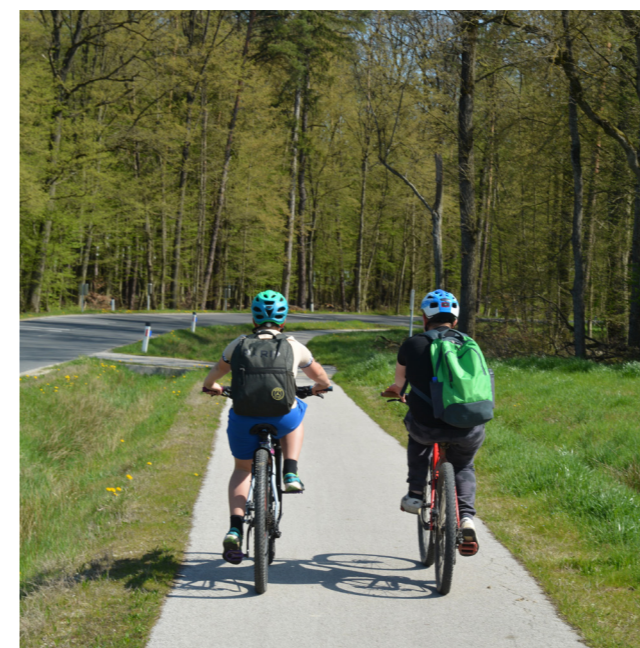
Nova kolesarska povezava med naselji Boreci in Logarovci.