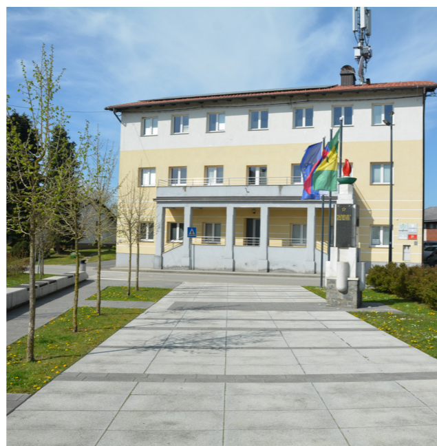
Urejen osrednji trg in javni prostor pri občinski stavbi v središču Križevcev.

Naš trud se odraža v zadovoljstvu prebivalcev s stanjem prometa v občini.